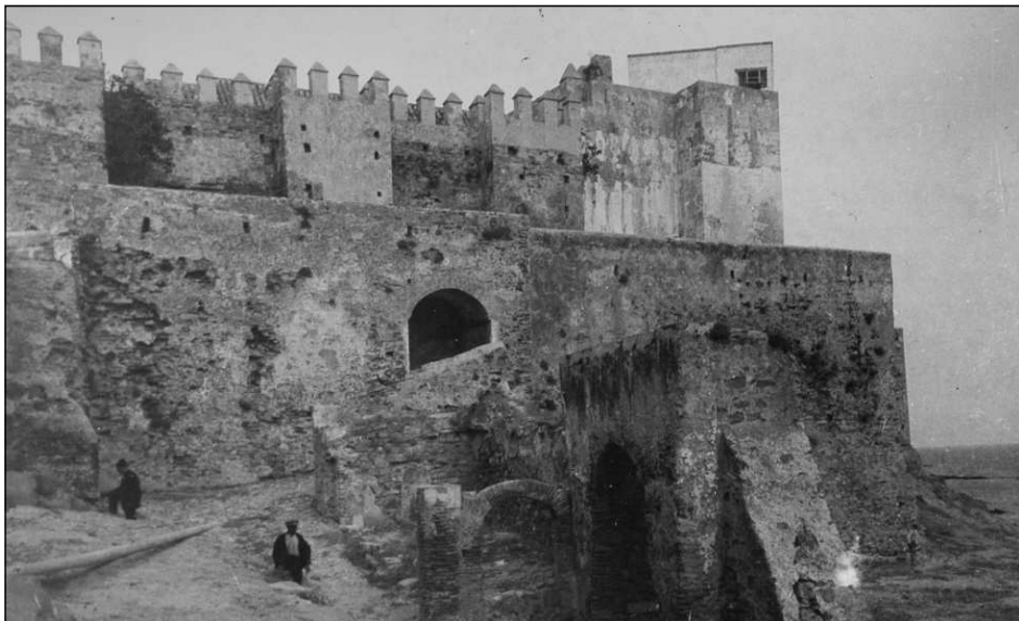
Vista del Castillo con los restos de la Capilla del Alcaide. Foto: Archivo Mas, 1926.