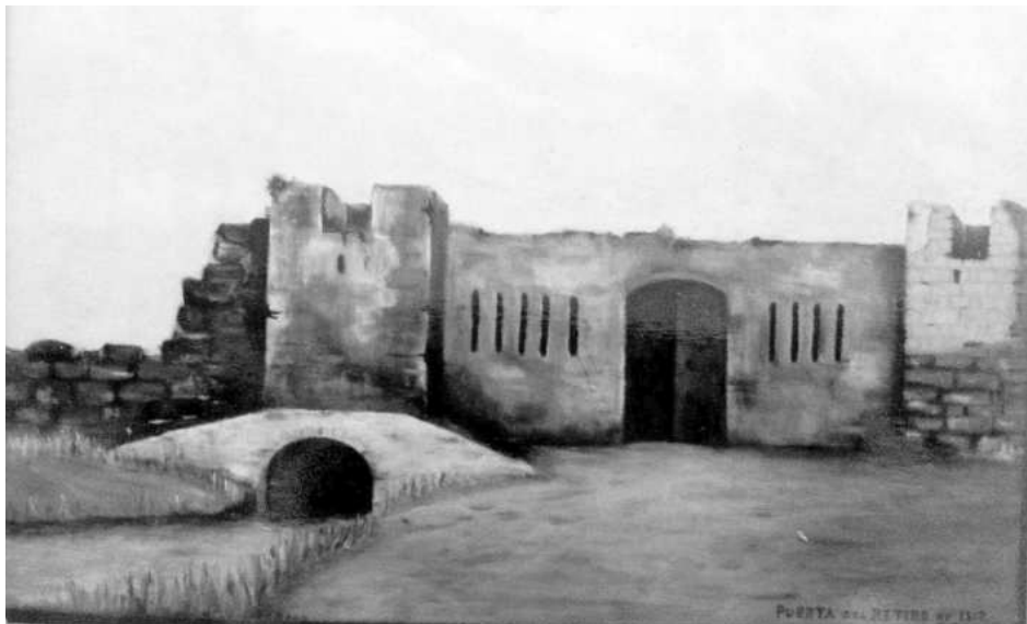
Puerta del Retiro. Pintura de Juan Labao.